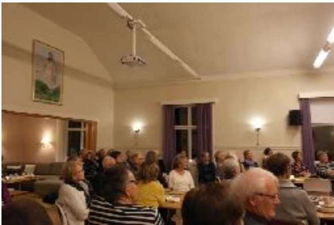
Mykje folk var samla på møtet på Kaupanger Bedehus.

ta seg av den daglege drifta, men du måtte ta den jobben på deg sjølv. Takk for det du gjorde i ei slik krevande tid»